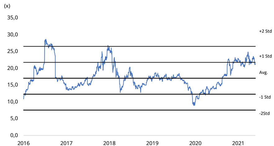
Hình 2: P/E 5 năm của GAS

Với mức dự báo LNST năm 2021 đạt 9.275 tỷ đồng, EPS của GAS đạt 4.846 đ/cp với mức P/E mục tiêu +1 Std tương ứng 21,16 lần. Kỳ vọng GAS có thể đạt mức giá 102.500 đ/cp.