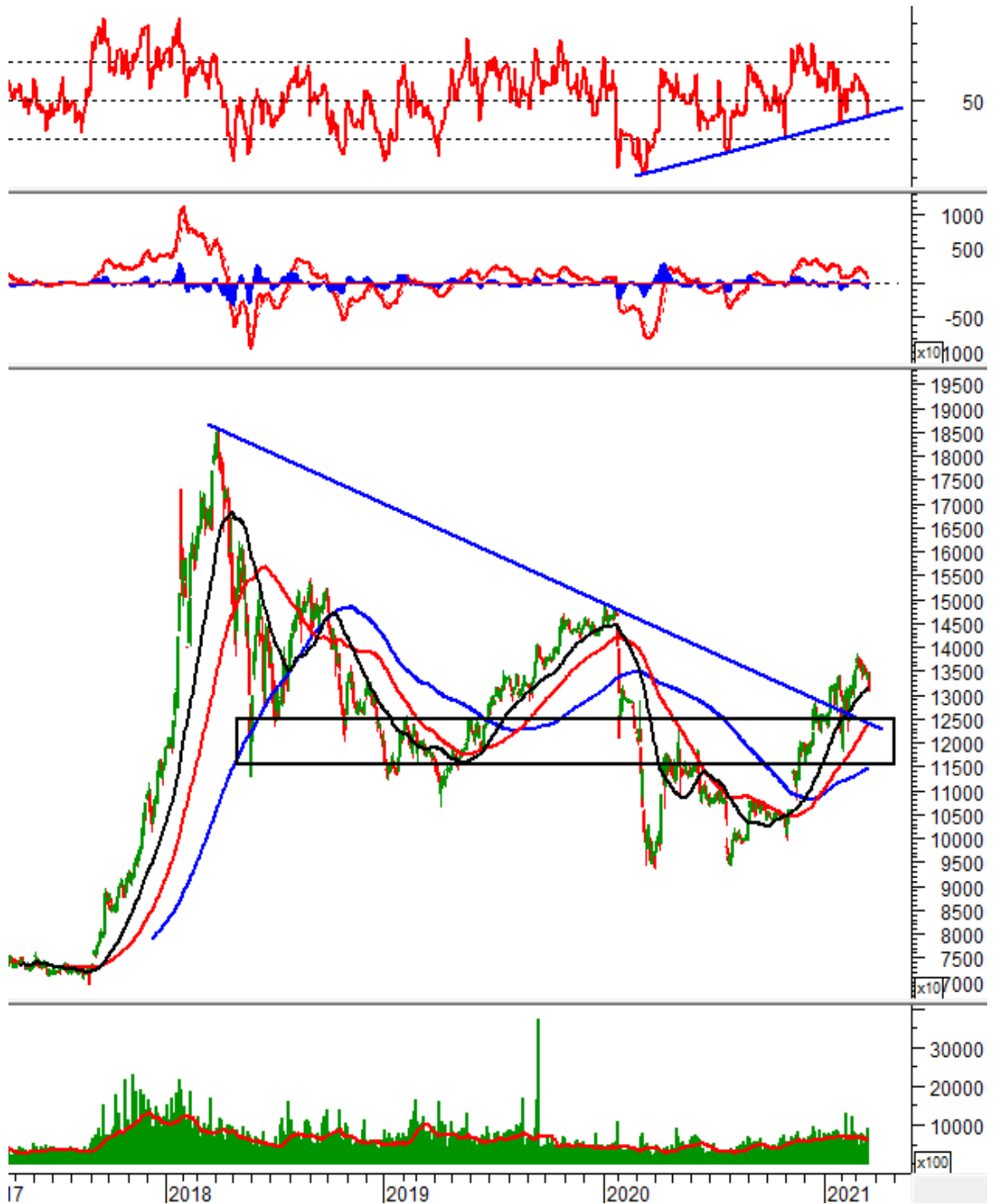
VPI - CTCP Đầu tư Văn Phú - INVEST

Đường Relative Strength Index đang về test lại trendline dài hạn (bắt đầu từ tháng 03/2021). Nếu chỉ báo này rơi hoàn toàn khỏi ngưỡng này thì rủi ro điều chỉnh của chỉ số sẽ tăng cao hơn.